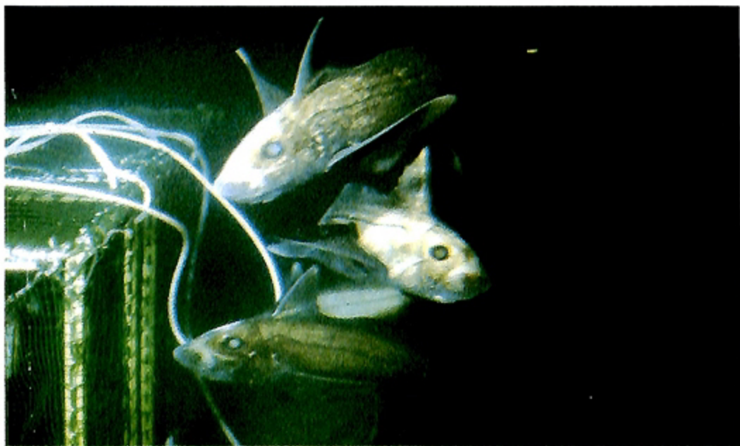
写真4 ムラサキギンザメとギンザメの1種 Photo. 4 Hydrolagus Purpureus and Hydrolagus sp