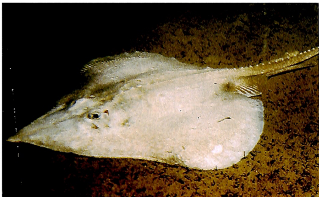
写真3 アラスカカスベ Photo. 3 Bathyraja aleutica .