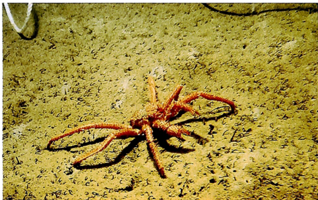
写真7 イバラガニの1種 Photo. 7 Paralomis sp.