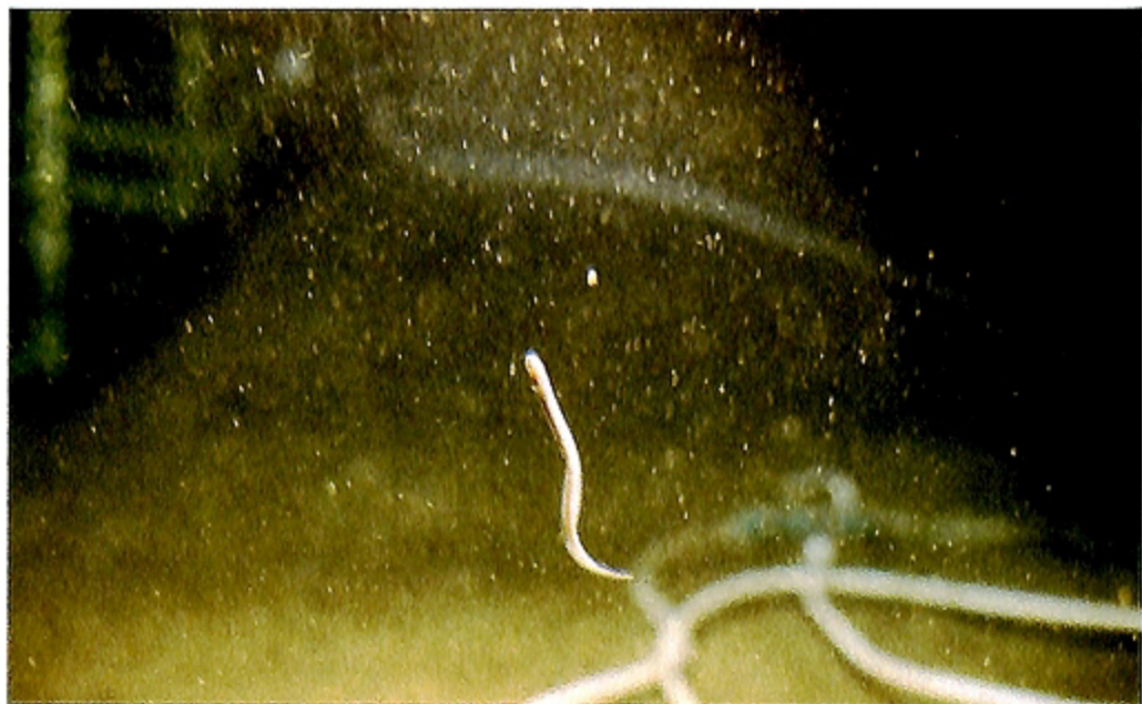
写真6 コンゴウアナゴ Photo. 6 Simenchelys parasiticus .