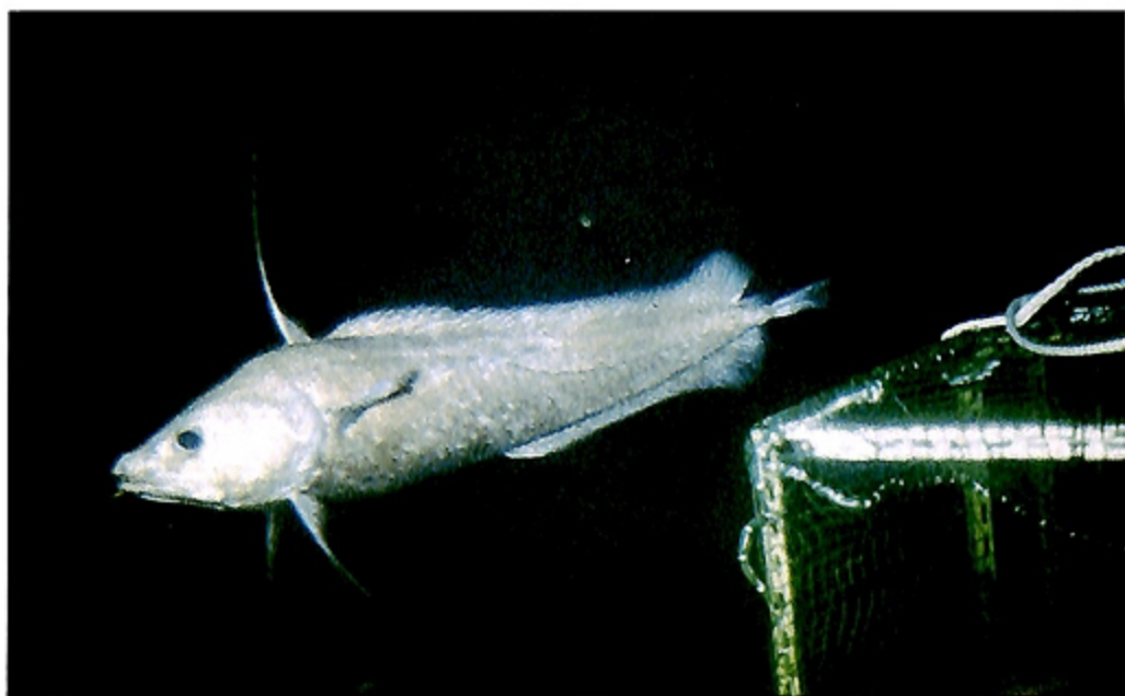
写真5 キタノクロダラ Photo. 5 Lepidion schmidti .